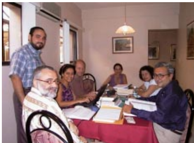
Grupo de especialistas revisores de la Farmacopea Vegetal Caribeña.