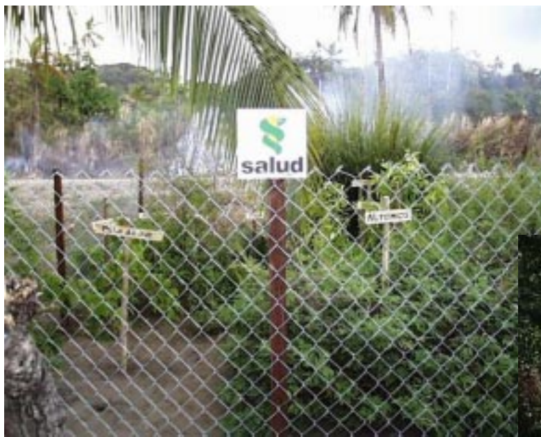
Jardín en el Centro de Salud de Miramar, Panamá.